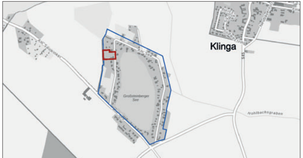
Übersichtskarte: Geltungsbereich Bebauungsplan (blau) und Änderungsbereich (rot)

Für die Bekanntmachung Anna-Luise Conrad Bürgermeisterin der Stadt Naunhof