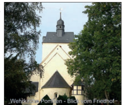
Wehrturm Pomßen - Blick vom Friedhof