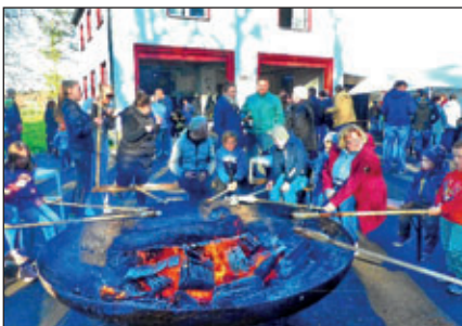
Text und Fotos: M. Görl