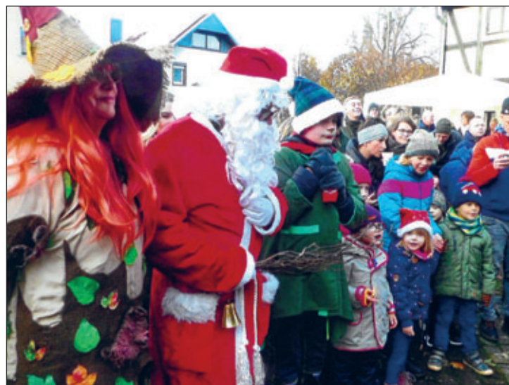
Text und Fotos Manfred Görl

50 kleine Geschenkbeutel, welche dem Weihnachtsmann zu viel eingepackt wurden, gingen zu den Kindern des Macherner Kinderheims auf die Reise und wurden dort übergeben.