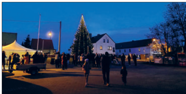
Text und Fotos: Vicky Prengel

Der Heimatverein „Grethener Störche“ wünscht allen eine schöne Vorweihnachtszeit, besinnliche und fröhliche Festtage und einen guten Rutsch in ein neues aufregendes Jahr.