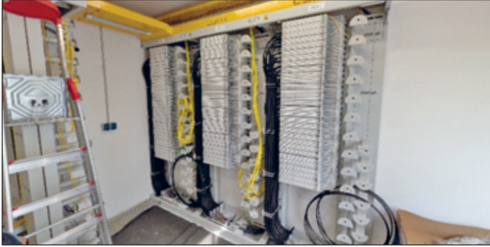
Innenansicht vom PoP

Seit dem 02.04.2025 ist die Gemeinde Parthenstein nachweislich an das schnelle Glasfasernetz angeschlossen. Mit dem Feuerwehrgerätehaus Pomßen konnte der erste Kunde online gehen. Die Gemeinde Pomßen wurde dabei gewählt, weil sie sich direkt neben dem Point of Presence (PoP) befindet und so eventuell auftretende Fehler hätten rasch behoben werden können. Ohne Zwischenfälle konnte die Feuerwehr online gehen und nun können die Hausanschlüsse, welche einen Vertrag abgeschlossen haben, durch die Drathlos DSL GmbH aktiviert werden. Dabei ist ein weiterer Hausbesuch zur endgültigen Installation und Übergabe der aktiven Technik (i.d.R. eine „Fritzbox“) notwendig.