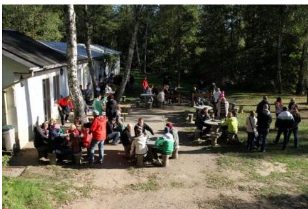
Gemütliches Beisammensein mit Kaffee und Kuchen